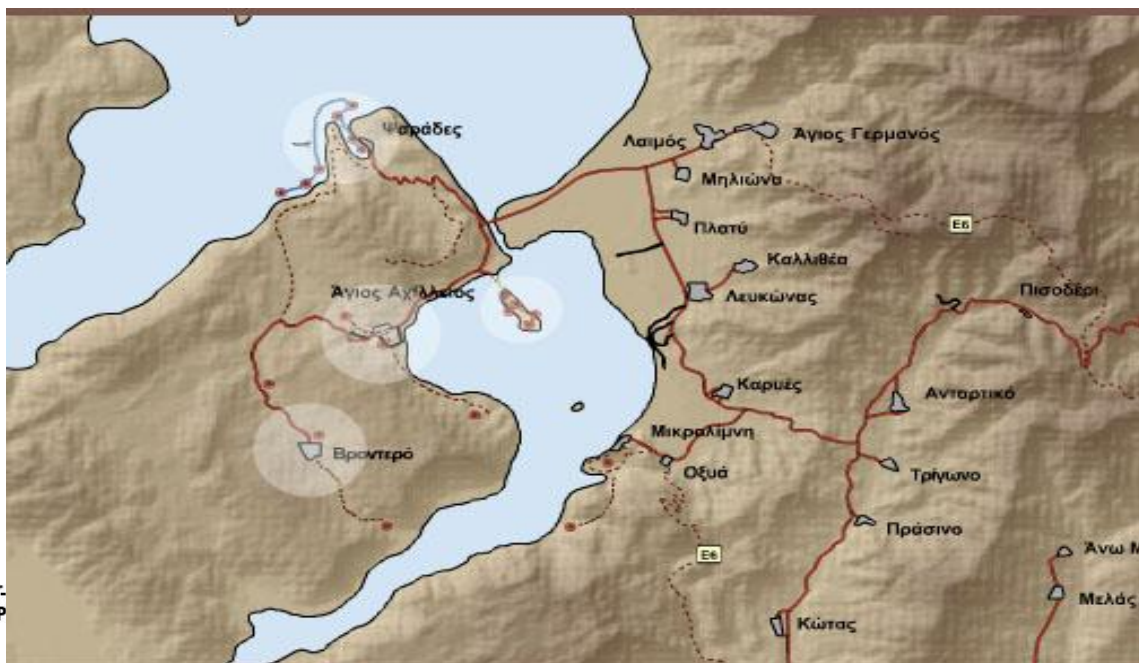
Χάρτης 3: Διαδρομές μονοπατιών στην περιοχή Πρεσπών του Ν. Φλώρινας

Στον χάρτη που ακολουθεί φαίνονται οι διαδρομές που ακολουθούνται από τα μονοπάτια.